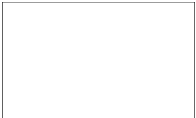
図 2 実験結果(2)